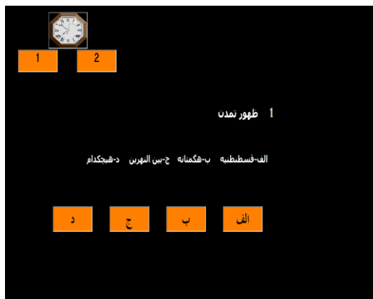
شکل ۱. نمایی از ورژن فارسی تکلیف کامپیوتری حافظه آینده‌نگر زمان محور

۲) نرم‌افزار تی. بی. پی. ام: برای اجرای این پژوهش، ورژن فارسی نرم‌افزار تی. بی. پی. ام بر اساس دی. ام. دی. ایکس ۴ که مک فارلند و گلیسکی ۵ [۱۱] برای ارزیابی حافظه‌ی آینده‌نگر زمان محور از آن استفاده کرده بودند، به کار رفت. تمام سؤالات اطلاعات عمومی و گزینه‌ها به زبان فارسی برگردانده و هنجاریابی شده بود. در این ابزار که با رایانه اجرا شد، شرکت‌کنندگان دو تکلیف داشتند: نخست، پاسخ به پرسشنامه‌ای چهار جوابی که به اطلاعات عمومی مربوط بود و هر سؤال به مدت ۱۲ ثانیه بر صفحه‌ی رایانه ظاهر می‌شد، دوم، تکلیف حافظه آینده‌نگر که در آن آزمودنی می‌بایست هر پنج دقیقه و در حین پاسخ به پرسشنامه‌ی اطلاعات عمومی یکی از دو کلید یک یا دو را فشار دهد. پنج دقیقه بعد از شروع تکلیف، آزمودنی می‌بایست کلید یک و پنج دقیقه بعد کلید دو را فشار دهد و رأس پنج دقیقه‌ی سوم کلید یک و تا آخر. در کل کلیدهای یک یا دو می‌بایست هشت بار در طول زمان پاسخ‌دهی به سؤالات فشار داده شوند (۴۰ دقیقه). برای کنترل زمان یک آیکون ساعت در این نرم‌افزار وجود دارد که بالا و گوشه‌ی سمت راست صفحه‌ی نمایش قابل مشاهده است. آزمودنی‌ها برای هر بار دیدن زمان می‌بایست روی آن کلیک می‌کردند تا بتوانند زمان دقیق انجام دادن تکلیف دوم را مشاهده کنند.